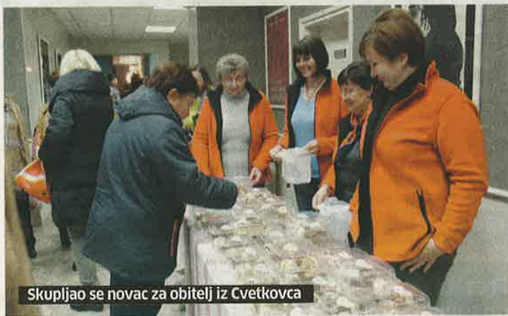
Skupljao se novac za obitelj iz Cvetkovca

- Iznos se svakog dana povećava jer ljudi dobrog srca stalno uplaćuju svoje donacije, a akcija traje do 18. siječnja sljedeće godine tako da još ima vremena za one koji žele uplatiti - rekla je Slavica Stančec, predsjednica Udruge žena Vinica. (sm)