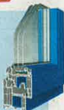
Salamander System bluEvolution