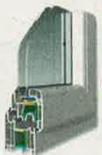
Salamander System 3D

NAJBOLJI ODNOS CIJENE I KVALITETE - PROVJERITE!